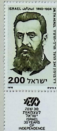
Theodor HERZL 1860–1904, Albia-Wien 1880, Journalist, Schriftsteller, Begründer des politischen Zionismus