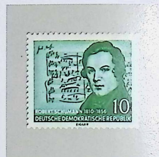
Robert SCHUMANN 1810–1856, alte Leipziger Burschenschaft 1828, Komponist und Musikschriftsteller