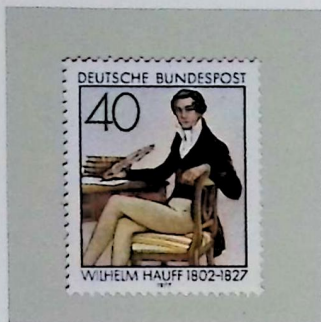
Wilhelm HAUFF 1802–1827, Germania-Tübingen 1820, Dichter und Schriftsteller