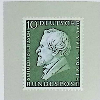
Hermann SCHULZE-DELITZSCH 1808–1883, alte Leipziger Burschenschaft 1827, Volkswirt, M. d. R., Schöpfer der deutschen Erwerbs- und Wirtschaftsgenossenschaften