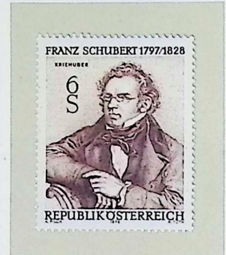
Franz SCHUBERT 1797–1828, Burschenschaftlicher Kreis – Wien 1819, Komponist und Schöpfer des deutschen Kunstliedes