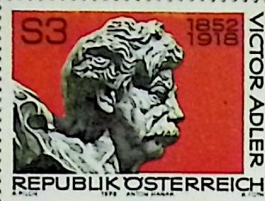
Victor ADLER 1852–1918, braune Arminia-Wien 1870, Reichsratsabgeordneter, Staatssekretär, Begründer der Österreichischen Sozialdemokratie