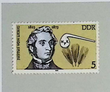
Justus Freiherr von LIEBIG 1803–1873, alte Bonner und Erlanger Burschenschaft 1820/22, Professor, Chemiker