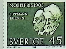
Rudolf EUCKEN 1846–1926, Frisia-Göttingen 1863, Professor, Philosoph, Nobelpreis 1908