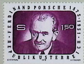
Ferdinand PORSCHE 1875–1951, Bruna Sudetia-Wien 1938, Autokonstrukteur, Industrieller