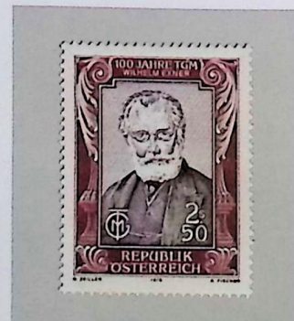
Wilhelm EXNER 1840–1931, Olympia-Wien 1859, Technologie und Begründer des Technologischen Gewerbe- museums in Wien, Reichsratsabgeordneter und Herrenhausmitglied