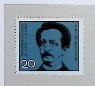
Ferdinand LASSALLE 1825–1864, B. d. Raczeks-Breslau 1843, Politiker und Gründer des Allgemeinen Deutschen Arbeitervereines