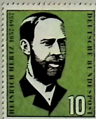
Heinrich HERTZ 1857–1894, Cheruscia-Dresden 1875, Physiker („Hertz'sche Wellen“)