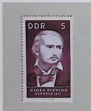
Georg HERWEGH 1817–1875, „Die Patrioten“-Tübingen 1835, Dichter und Revolutionär