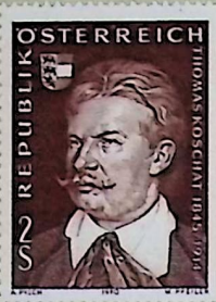
Thomas KOSCHAT 1845–1914, Alemannia-Wien 1865, Kärntner Tondichter