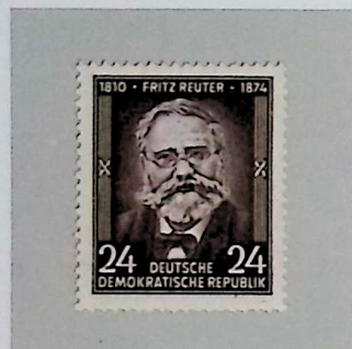
Fritz REUTER 1810–1874, Germania-Jena 1832, plattdeutscher Dichter und Humorist