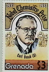
Carl BOSCH 1874–1940, Cimbria-Berlin 1894, Chemiker, Industrieller, Nobelpreis 1931