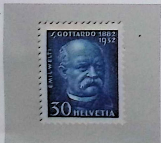
Emil WELTI 1825–1899, Burgkeller-Jena 1844, Schweizer Bundespräsident