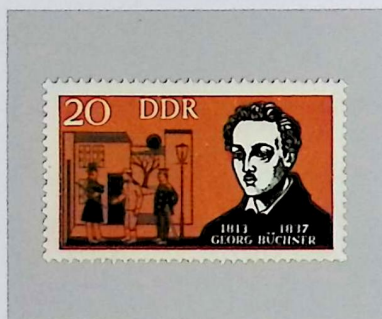
Georg BÜCHNER 1813–1837, Germania-Gießen 1831, Dichter und Revolutionär, Privatdozent