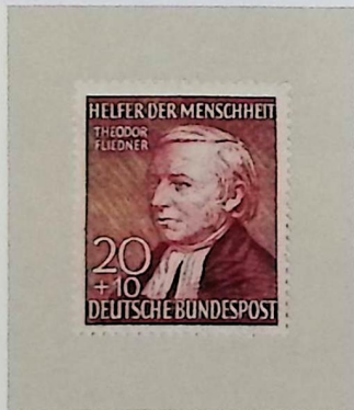
Theodor FLIEDNER 1800–1864, alte Germania-Gießen 1818, Begründer der weiblichen Diakonie in der evangelischen Kirche