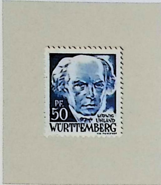
Ludwig UHLAND 1787–1862, Germania-Tübingen 1862, Dichter und Germanist, Abgeordneter zur Frankfurter National- versammlung