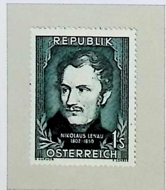
Nikolaus LENAU (Niembsch Edler von Strehlenau) 1802–1850, alte Franconia-Heidelberg 1831, Dichter