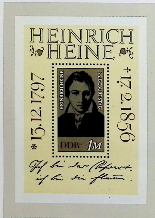
Heinrich HEINE 1797–1856, alte Bonner und Göttinger Burschenschaft 1819/20, Dichter und Schriftsteller