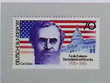
Carl SCHURZ 1829–1906, Frankonia-Bonn 1847, deutscher Freiheitskämpfer, amerikanischer Innenminister