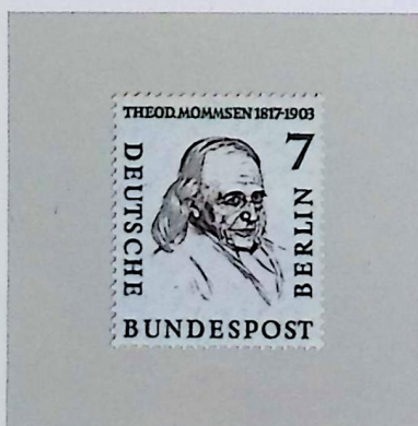
Theodor MOMMSEN 1817–1903, Albertina-Kiel 1835, Professor, Archäologe und Historiker, M. d. R., Nobelpreis 1902