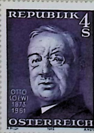
Otto LOEWI 1873–1961, Germania-Strasbourg 1892, Professor, Physiologe, Nobelpreis 1936